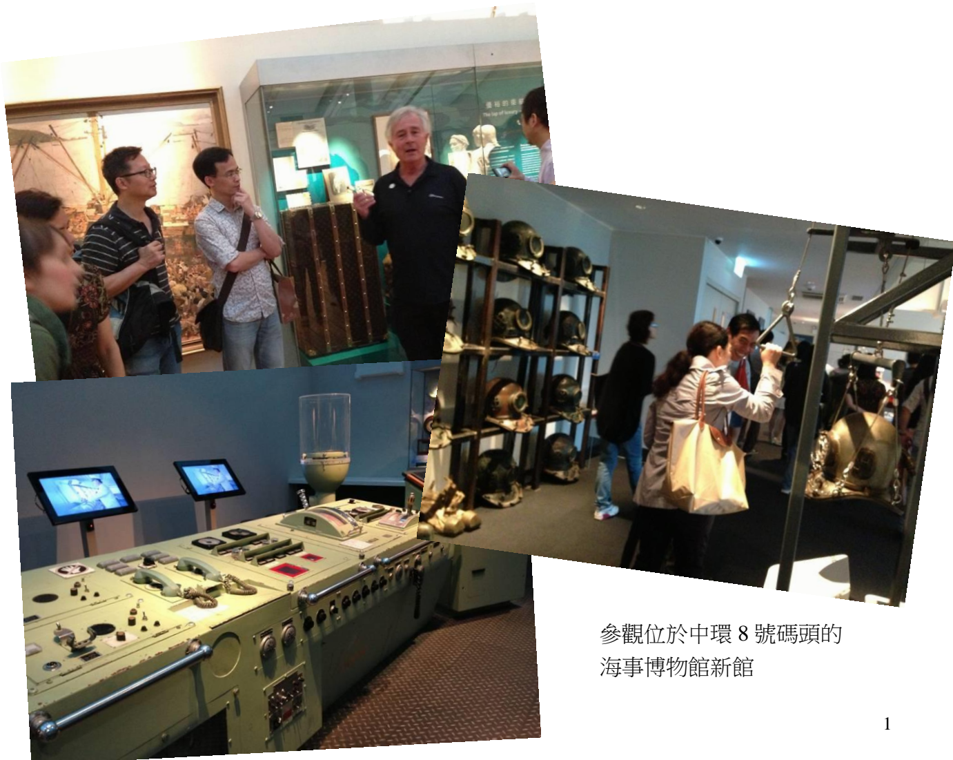
參觀位於中環 8 號碼頭的 海事博物館新館

我們在過去安排了多個展覽導賞及參觀活動，例如：安迪•華荷：十五分鐘的永恆(25.3.2013)、法貝熱 – 俄羅斯宮廷遺珍(13.4.2013)、探本溯源：美索不達米亞古文明展(4.5.2013)、參觀海事博物館新館(25.5.2013)及敦煌 – 說不完的故事(7.2.2015)，並邀請到專責的「星級館長」為參加者介紹展品和分享展覽背後的有趣故事，在此感謝各有關館長的義務協助和各會員的支持，希望將來協會能為大家籌劃更多精彩的參觀活動。