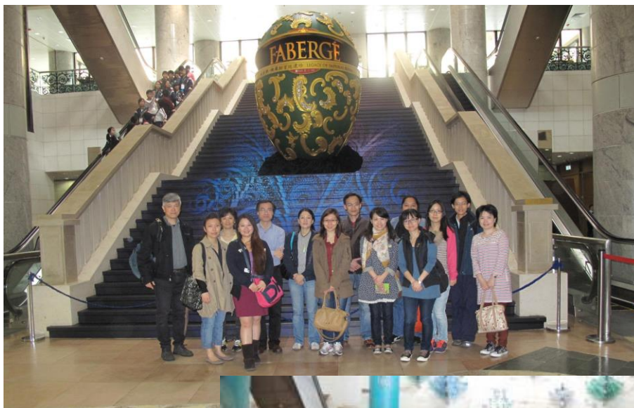
參觀「法貝熱 - 俄羅斯宮廷遺珍」(上圖)及「敦煌 - 說不完的故事」(下圖)